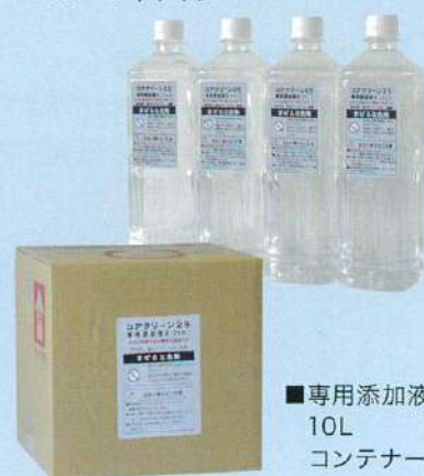
■専用添加液 10L コンテナ