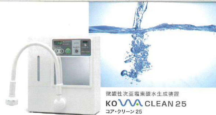
微酸性次亜塩素酸水生成装置 KOWA CLEAN 25 コア・クリーン 25