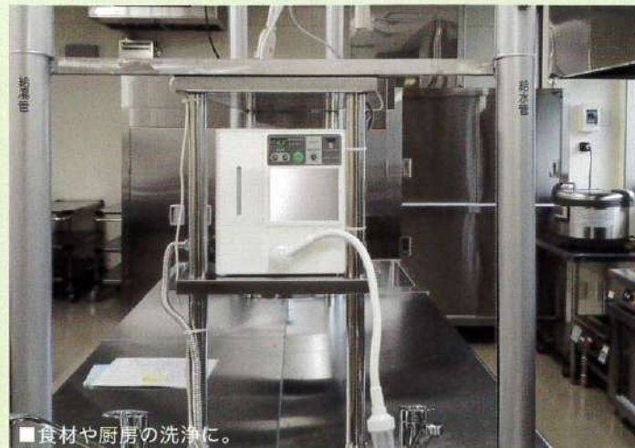
■食材や厨房の洗浄。