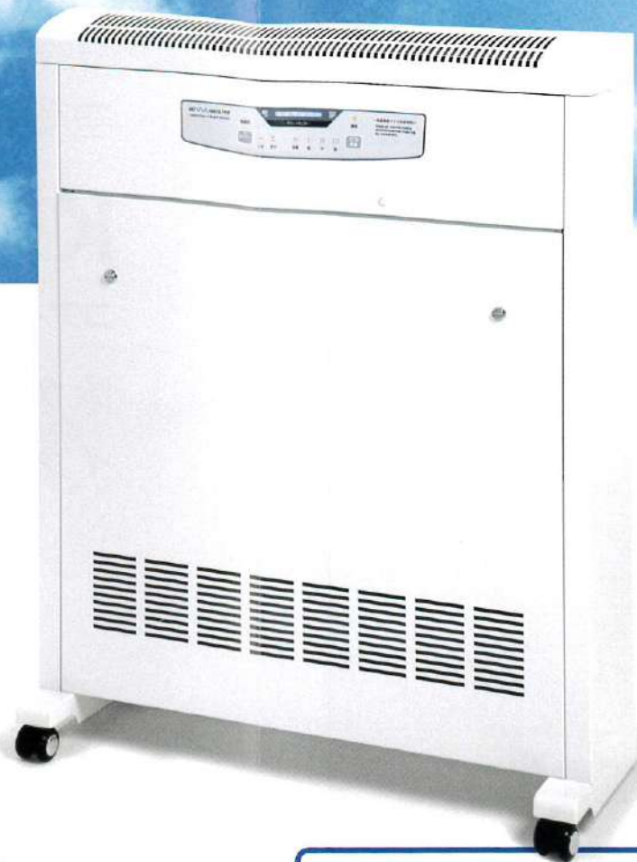
空気除菌脱臭装置 KOV A MEISTER コア・マイスター[ホープ15F]