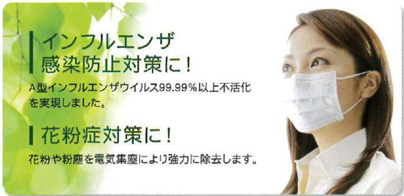
空気除菌脱臭装置 KOV A MEISTER コア・マイスター[ホープ15H]

空気除菌脱臭装置コア・マイスターは、室内の細菌やウイルスなどを電気集塵で捕集し、紫外線殺菌灯で照射殺菌・不活化します。さらに気になる臭いの成分を光触媒フィルターで分解・脱臭し、クリーンでヘルシーな空気環境づくりをサポートいたします。