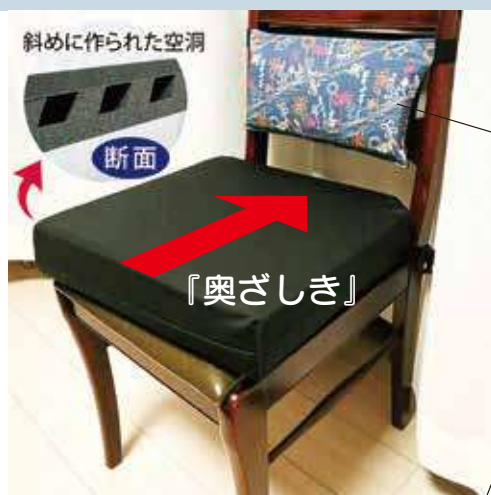
付属品「背当てクッション」